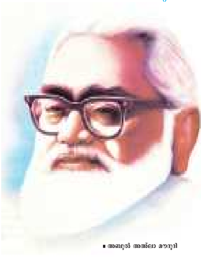
■ അബൂൽ അഅ്ലാ മൗദൂദി

തികച്ചും അന്യാഭ്യൂതമാണ് മൗദൂദിയുടെ വ്യക്തിത്വം. അദ്ദേഹവുമായി അടുക്കുംതോറും ആ പ്രഹുല്ല വ്യക്തിത്വത്തിന്റെ നറു മണം നമുക്ക് അനുഭവഭവേദ്യമാകുന്നു. ബന്ധം എത്രത്തോളം ഗാഢമാകുന്നുവോ അത്രത്തോളം ആ മഹിത വ്യക്തിത്വത്തിന്റെ മാഹാത്മ്യം ബോധ്യപ്പെടുന്നു. സ്വഭാവപരമായും ധാർമികപരമായും ചിന്താപരമായും വൈജ്ഞാനികമായും ഒരേസമയം ഒരു മനുഷ്യൻ എത്ര ഉയർന്ന നിലവാരം കൈവരിക്കാൻ കഴിയുമെന്നതിന്റെ ജീവിക്കുന്ന ദൃഷ്ടാന്തമാണ് മൗലാനാ.